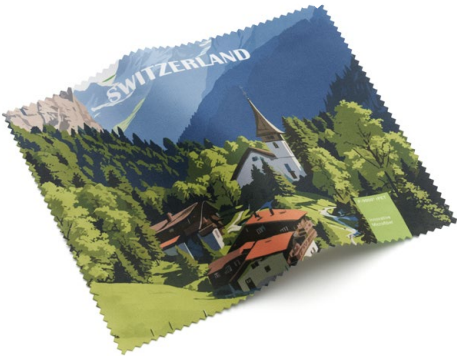
Ansicht des fertigen Brillentuchs